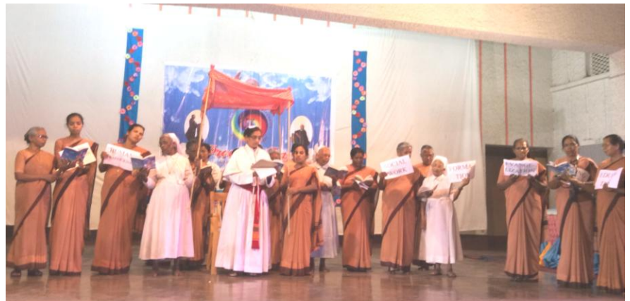
savonds was er een cultureel programma