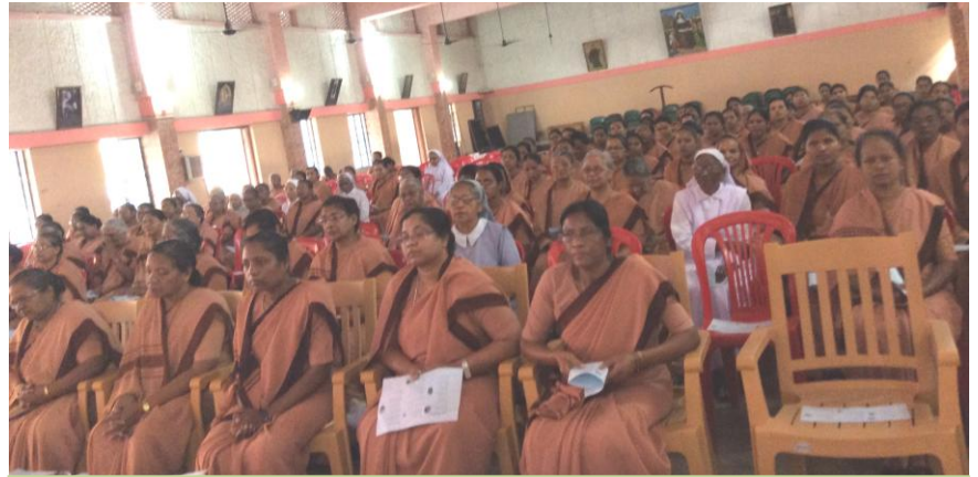
Zusters zijn op Sessie