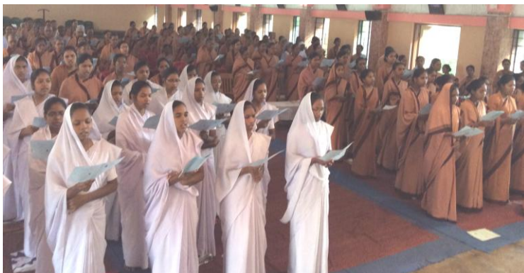
Eucharistieviering met de Novicen en de Zusters