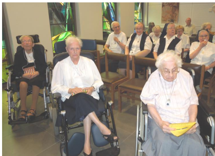
Zusters van Floordam in gebed

In onze gemeenschap leven 14 zusters. Zij zijn van verschillende Belgische gemeenschappen gekomen en uit Congo, waar zij als missionarissen werkzaam waren. Zij zijn hier om goed verzorgd te worden.